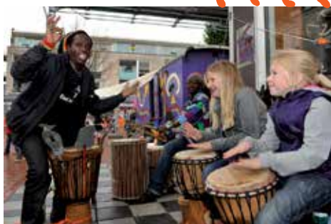
Camminghaburen: Pret in De Kunst-KEET.