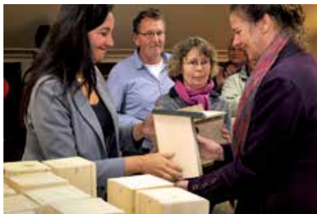
Huizum-West: 200 nestkasten voor wijkbewoners.