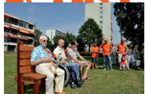
Nijlân: Schuifmaatje: bank met plaats voor scootmobiel of rollator.