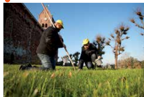
Wirdum/ Swichum: Inwoners van Swichum planten het Aytablomke.