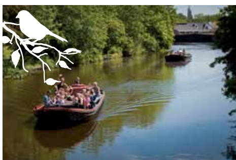
Wielenpôle/ Schepenbuurt: Praamvaart voor de jonge wijkbewoners.