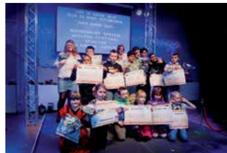
Vrijheidswijk: Kinderen en jongeren (4-18 jr.) verdienen een Wijkwaardebon.