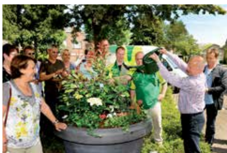
Aldlân-Oost: bewoners fleuren de Keizerskroon op.