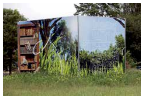
Westeinde: Bert van Tuinen brengt kleur in de wijk met zijn kunstwerken op stroomkasten.